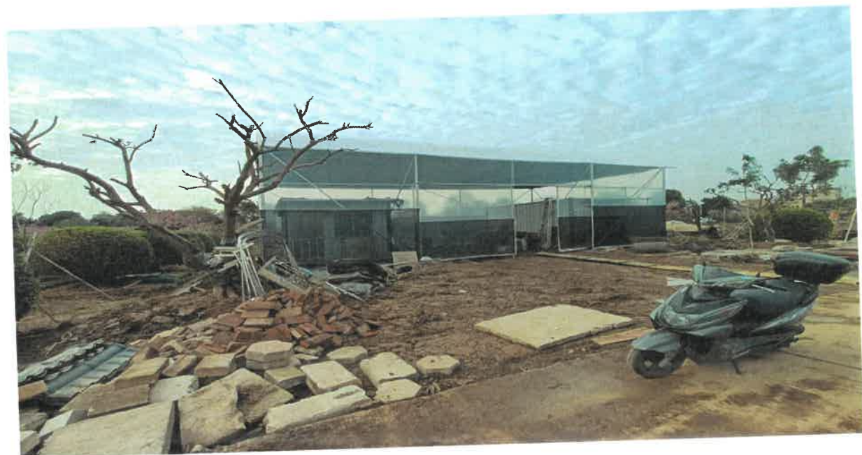
设施农业用地涉及地类面积明细表